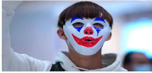
Resim 9. Hong Kong'daki bir gösterici 18 Ekim'deki bir protestoda Joker maskesi takıyor.

Çin'in Hong Kong Özel İdari Bölgesi'nde yönetimin eylemlerde maske takma yasağı getirmesinin ardından göstericiler söz konusu yasağı protesto etmek için Joker maskesi takarak veya yüzlerini Joker gibi boyayarak eylemlere katılmış ve yasağı protesto etmişlerdir (URL-17).