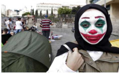
Resim 4. Lübnan'daki bazı göstericiler yolsuzlukları ve siyasi elitleri Joker makyajıyla protesto ediyor.