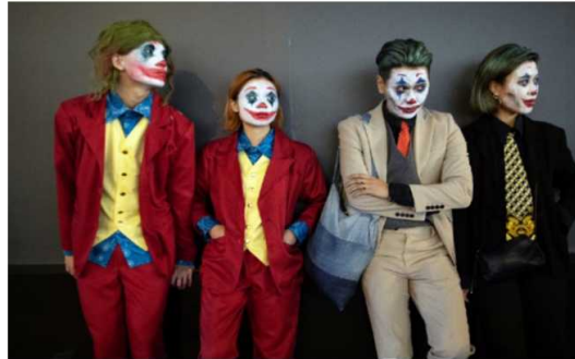
Resim 10. Joker kostümü veya yüz boyasıyla bir grup gösterici.