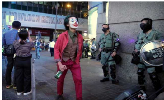
Resim 11. Hong Kong'da Cadılar Bayramı kostümüyle (Joker kostümü) polislerin önünden geçen bir adam.