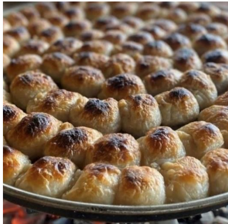
Şekil 6 Boşnak Mantısı