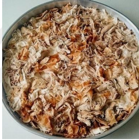
Şekil 5 Potoplika