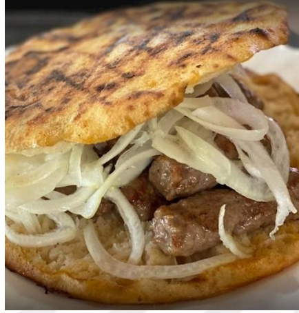
Şekil 1 Cevapi (Boşnak Kftesi)