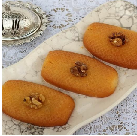
Şekil 10 Hurmaşica