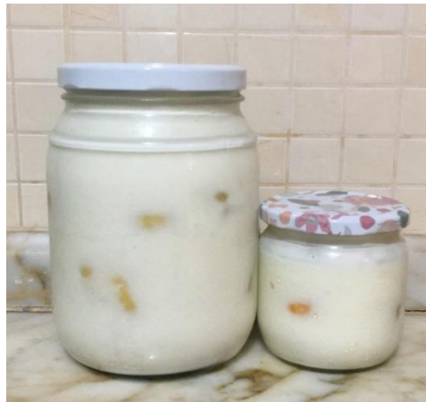
Şekil 3 Soka