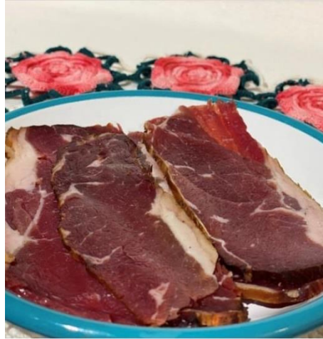
Şekil 2 Suho meso (Kuru et)